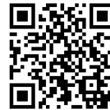
椎田中学校 保護者連絡